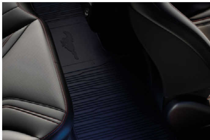
DYWANIKI PODŁOGOWE, GUMOWE - Z PRZODU I Z TYŁU (2 526 938)