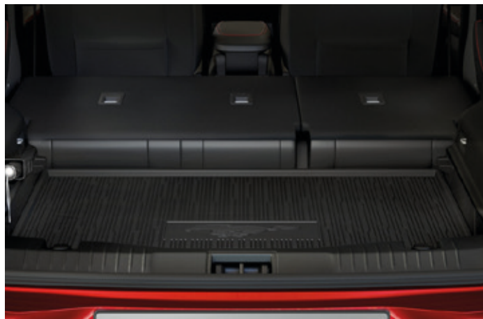
MATA GUMOWA DO BAGAŻNIKA Z LOGO MUSTANGA (2 465 296)