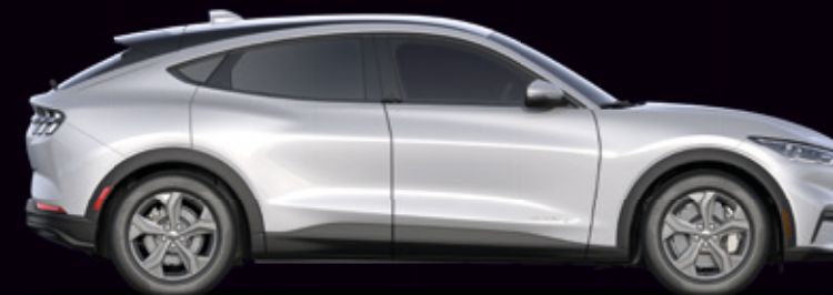
FORD MUSTANG MACH-E | RWD | KOLOR NADWOZIA: SPACE WHITE (OPCJA)