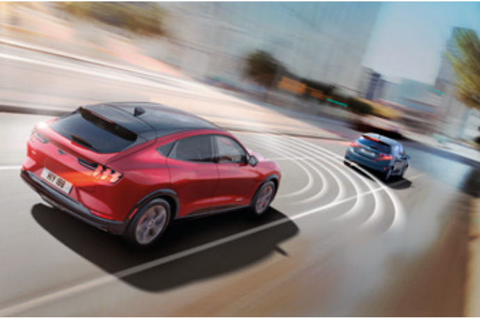
AKTYWNY TEMPOMAT Z FUNKCJĄ UTRZYMANIA POJAZDU NA ŚRODKU PASA RUCHU Standard dla wszystkich wersji