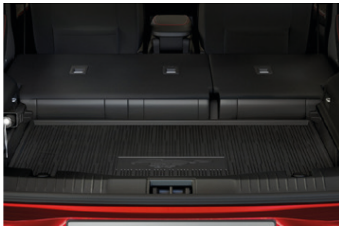
MATA GUMOWA DO BAGAŻNIKA Z LOGO MUSTANGA (2 465 296)