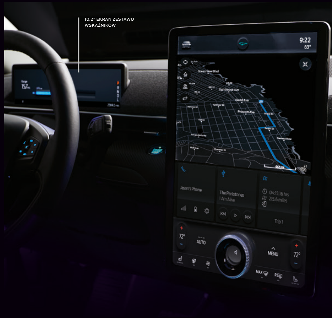
FORD MUSTANG MACH-E