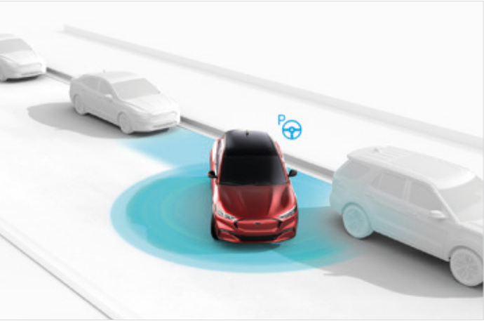
ACTIVE PARK ASSIST 2 Opcja dostępna w pakietach Technology oraz Technology Plus