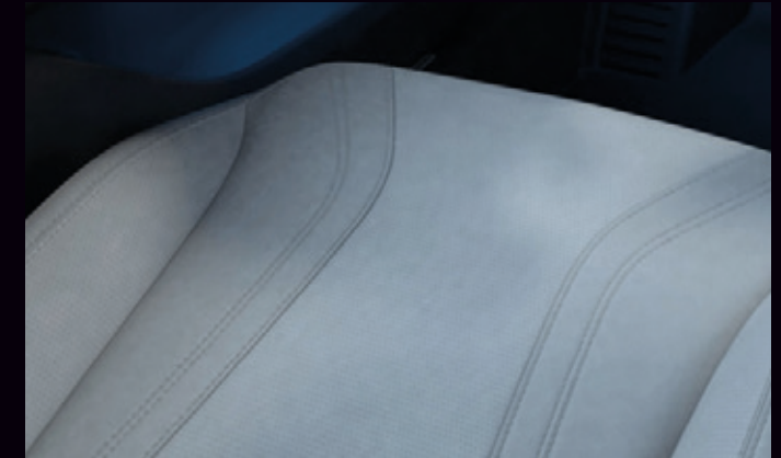
JASNA TAPICERKA PERFOROWANA SENSICO