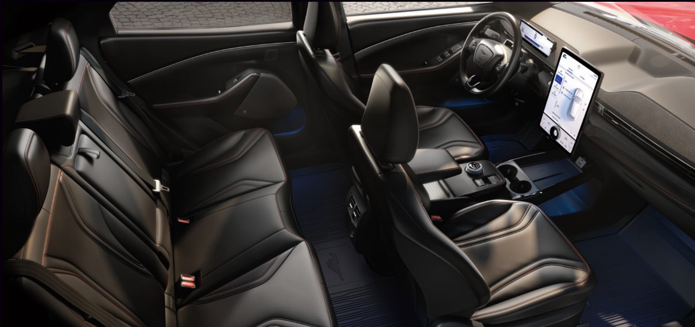
FORD MUSTANG MACH-E | AWD