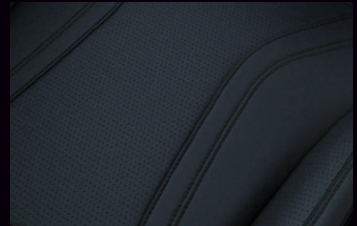
TAPICERKA PERFOROWANA SENSICO

Opcja dostępna w pakietach Technology oraz Technology Plus