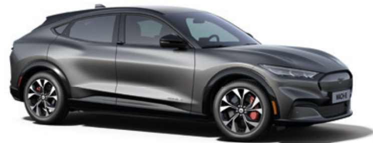
DARK MATTER GREY - LAKIER METALIZOWANY 5 000,-