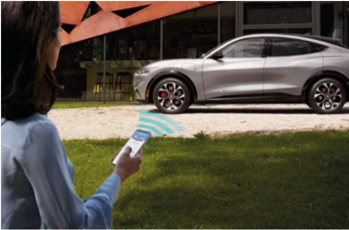
FUNKCJA OTWIERANIA, ZAMYKANIA ORAZ URUCHAMIANIA POJAZDU ZA POMOCĄ SMARTFONA Standard dla wersji AWD