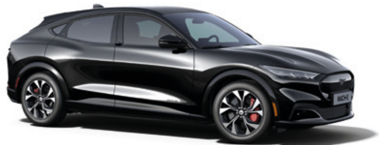
ABSOLUTE BLACK - LAKIER SPECJALNY bez dopłaty