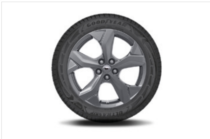
KOMPLETNE KOŁA ZIMOWE ALUMINIOWE 18" Z OPONAMI GOODYEAR UG PERF SUV G1 XL, 225/60 R18 104V (2 485 238)