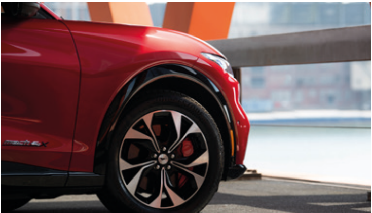
OSŁONY NADKOLI LAKIEROWANE W KOLORZE CZARNYM Standard dla wersji AWD