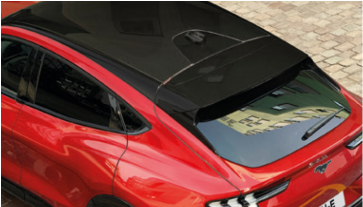
DACH PANORAMICZNY - NIEOTWIERANY Dla wersji RWD i AWD Opcja dostępna w pakietach Technology oraz Technology Plus Dla wersji GT opcja dostępna w pakiecie Technology GT