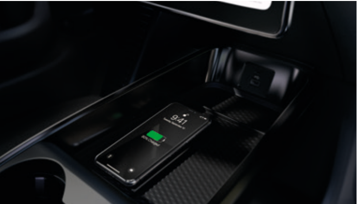
BEZPRZEWODOWA ŁADOWARKA Standard dla wszystkich wersji