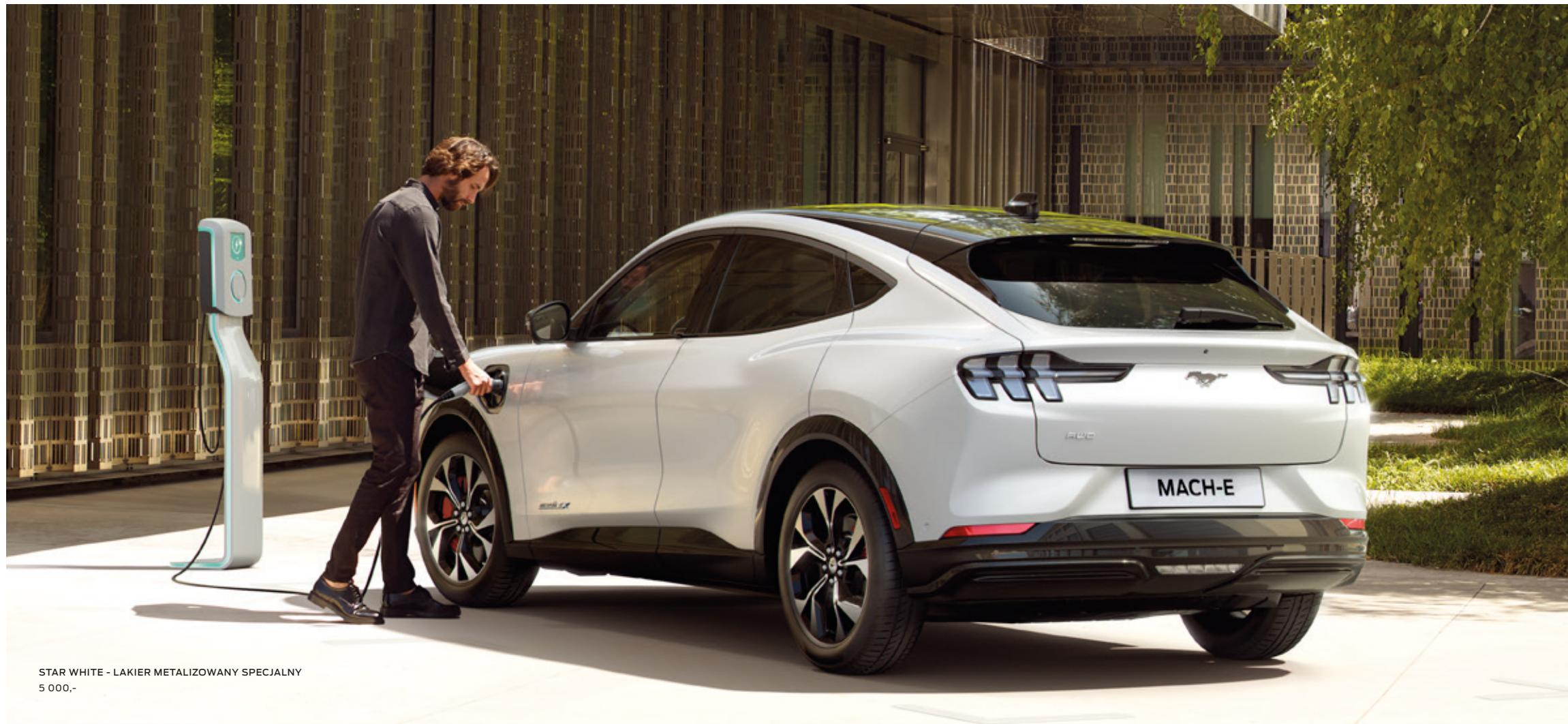
STAR WHITE - LAKIER METALIZOWANY SPECJALNY 5 000,-

FORD MUSTANG MACH-E | AWD | KOLOR NADWOZIA STAR WHITE (OPCJA) | SAMOCHÓD NA ZDJĘCIU WYPOSAŻONY W DACH PANORAMICZNY (OPCJA)