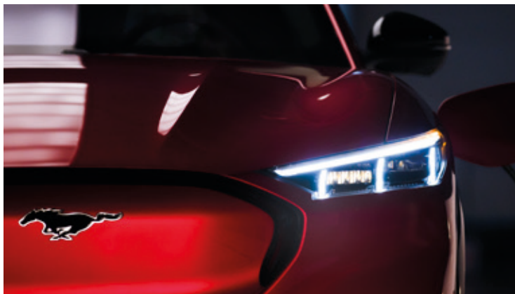
REFLEKTORY PROJEKCYJNE LED Standard dla wersji AWD i GT