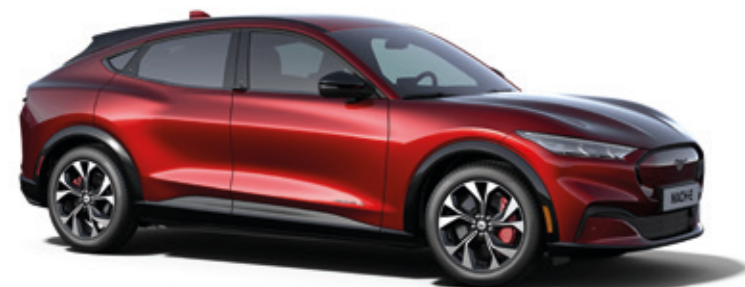
LUCID RED- LAKIER METALIZOWANY SPECJALNY 5 000,-