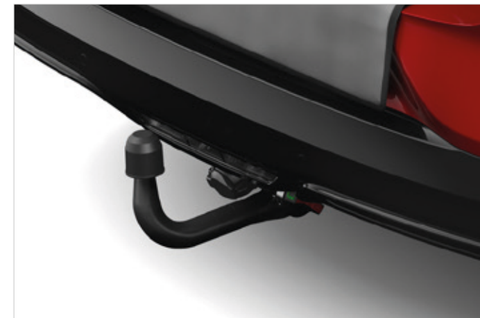
HAK HOŁOWNICZY - ODŁĄCZANY (2 483 493)