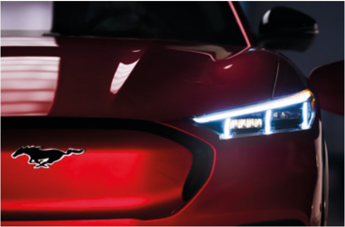
REFLEKTORY PROJEKCYJNE LED Standard dla wersji AWD