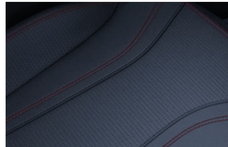
TAPICERKA PERFOROWANA ZE SKÓRY EKOLOGICZNEJ SENSICO Z CZERWONYMI PRZESZCICAMI Standard dla wersji AWD

WYKOŃCZENIE PRZEDNIEGO GRILLA LAKIEROWANE W KOLORZE CZARNYM