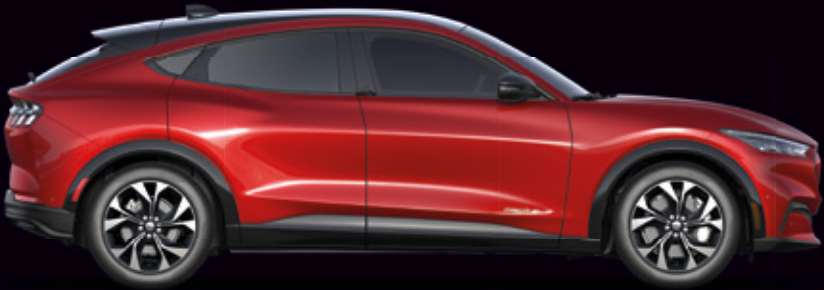
FORD MUSTANG MACH-E | AWD | KOLOR NADWOZIA: LUCID RED (OPCJA)