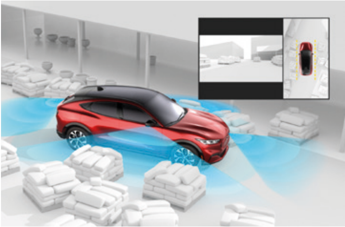
SYSTEM KAMER 360 STOPNI Opcja dostępna w pakietach Technology oraz Technology Plus