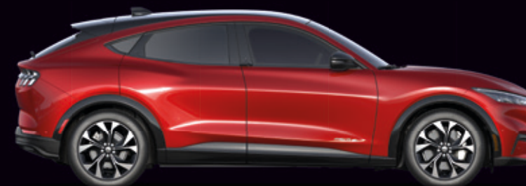
FORD MUSTANG MACH-E | AWD | KOLOR NADWOZIA: LUCID RED (OPCJA)