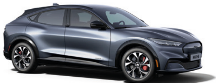
INFINITY BLUE- LAKIER METALIZOWANY SPECJALNY 4 200,-