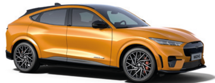
CYBER ORANGE - LAKIER METALIZOWANY SPECJALNY 5 000,-