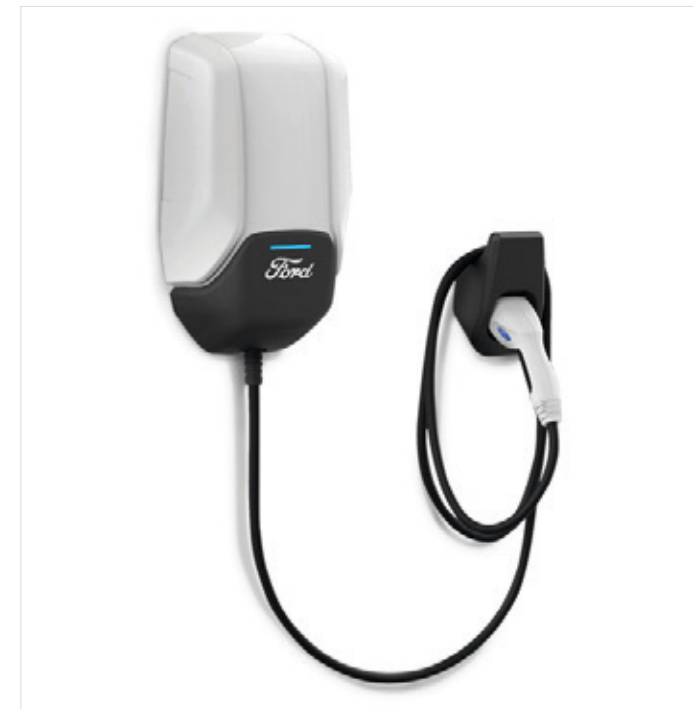
FORD CONNECTED WALLBOX DLA 3-FAZOWYCH SYSTEMÓW ZASILANIA ELEKTRYCZNEGO (2 576 303)

Inteligentne i wydajne rozwiązanie do ładowania w domu Twojego w pełni elektrycznego lub hybrydowego Forda. Bezpiecznie ładuje nawet do trzech razy szybciej niż w zwykłym gniazdku elektrycznym.