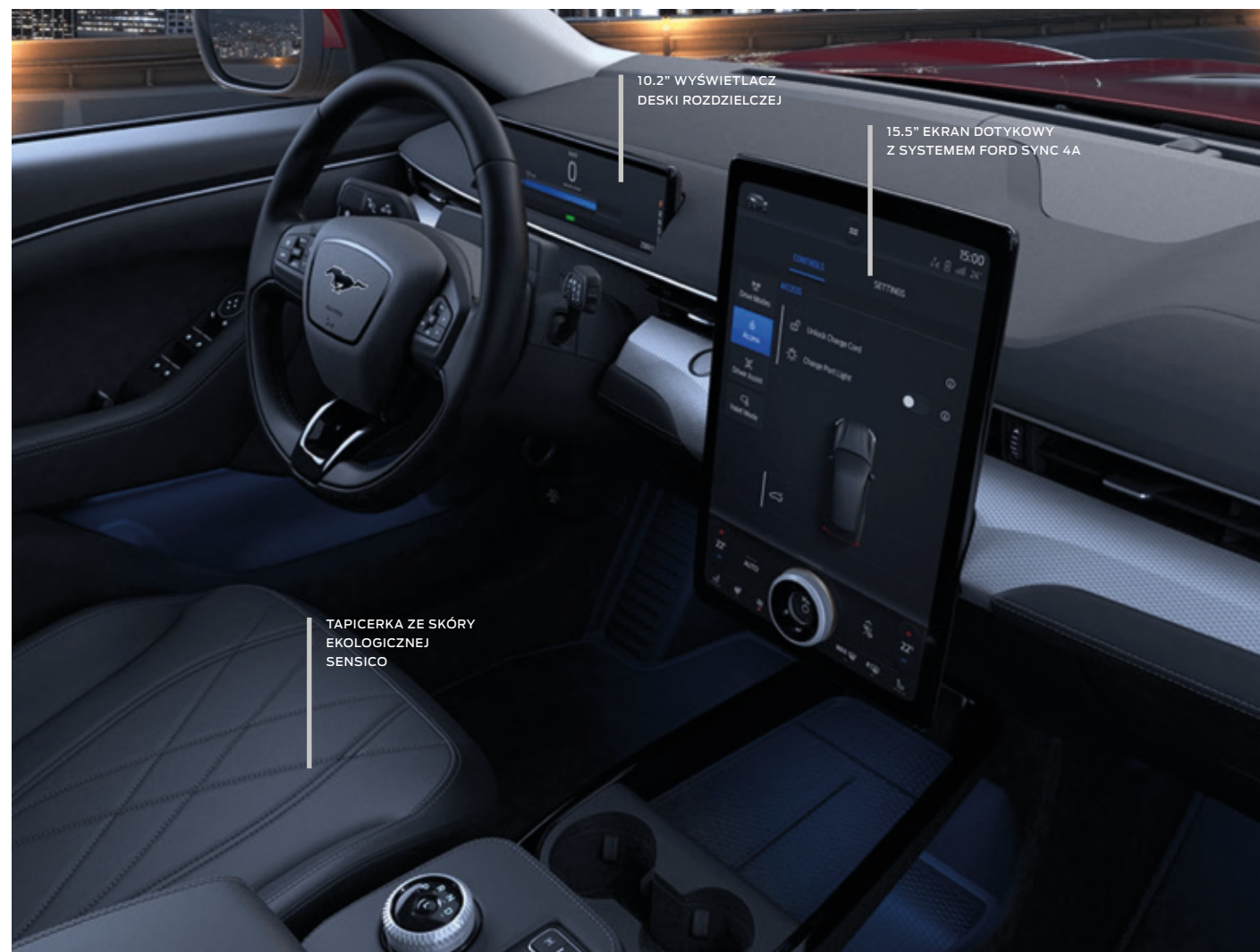
FORD MUSTANG MACH-E | RWD