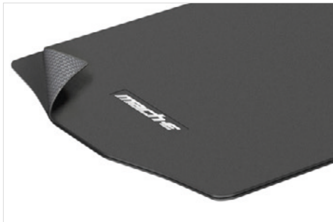
MATA DWUSTRONNA DO BAGAŻNIKA Z DODATKOWĄ OCHRONĄ ZDERZAKA (2 482 274)