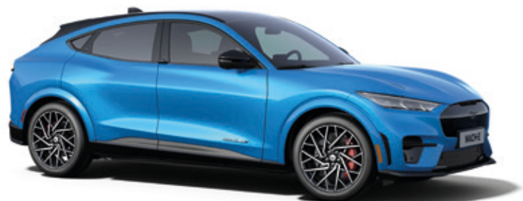
GRABBER BLUE - LAKIER METALIZOWANY 5 000,-