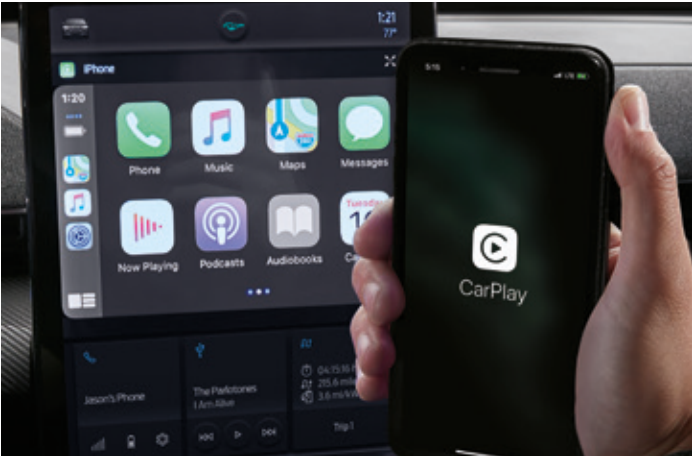
BEZPRZEWODOWA OBSŁUGA APPLE CARPLAY I ANDROID AUTO Standard dla wszystkich wersji. Wymaga kompatybilnego urządzenia.

Układ kierowniczy - ze wspomaganiem elektrycznym (EPAS)