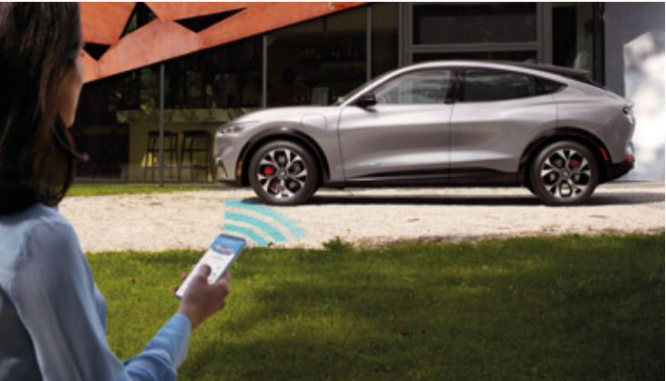
FUNKCJA OTWIERANIA, ZAMYKANIA ORAZ URUCHAMIANIA POJAZDU ZA POMOCĄ SMARTFONA Standard