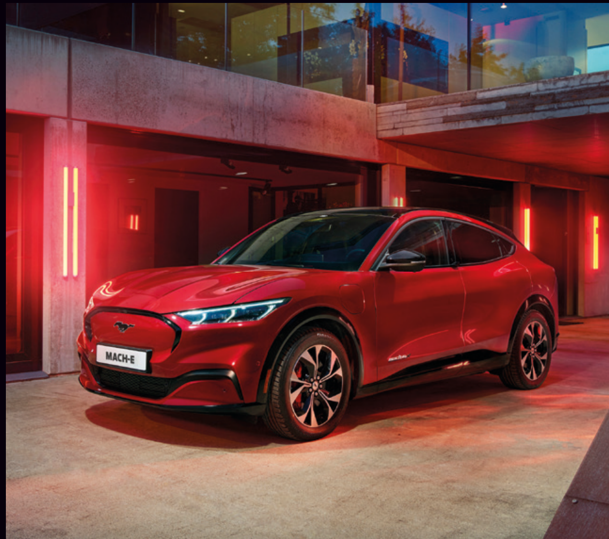
FORD MUSTANG MACH-E

Jury konkursu składa się z doświadczonych dziennikarzy motoryzacyjnych, będących autorytetami w swojej branży, zawodowo zajmujących się testowaniem i oceną samochodów. Pochodzą oni z różnych mediów i redakcji, dzięki czemu konkurs jest w pełni niezależny, demokratyczny, ponadredakcyjny i transparentny.