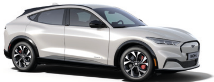
STAR WHITE - LAKIER METALIZOWANY SPECJALNY 5 000,-