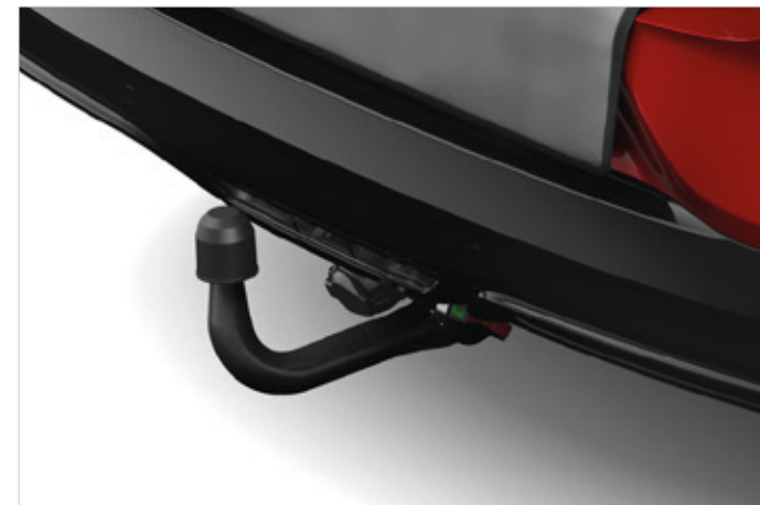
HAK HOLOWNICZY - ODŁĄCZANY (2 483 493)