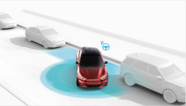
ACTIVE PARK ASSIST 2 Dla wersji RWD i AWD Opcja dostępna w pakietach Technology oraz Technology Plus Standard dla wersji GT