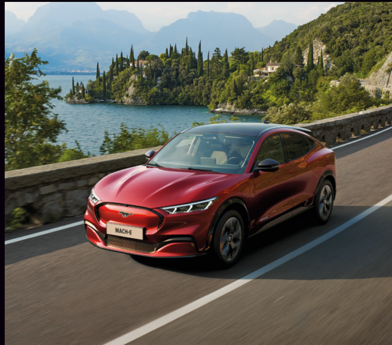
FORD MUSTANG MACH-E | AWD | KOLOR NADWOZIA LUCID RED (OPCJA) | SAMOCHÓD NA ZDJĘCIU WYPOSAŻONY W PAKIET TECHNOLOGY PLUS (OPCJA)

Wyraź siebie wybierając jeden z elektryzujących lakierów Mustanga MACH-E.