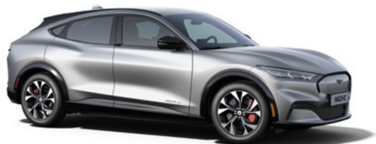
ICONIC SILVER - LAKIER METALIZOWANY 3 400,-