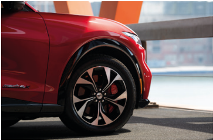
OSŁONY NADKOLI LAKIEROWANE W KOLORZE CZARNYM Standard dla wersji AWD