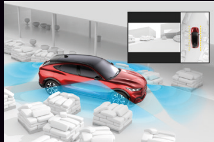
SYSTEM KAMER 360 STOPNI

Opcja dostępna w pakiecie Technology Plus