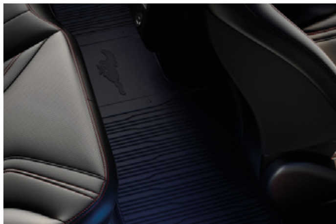
DYWANIKI PODŁOGOWE, GUMOWE - Z PRZODU I Z TYŁU (2 526 939)