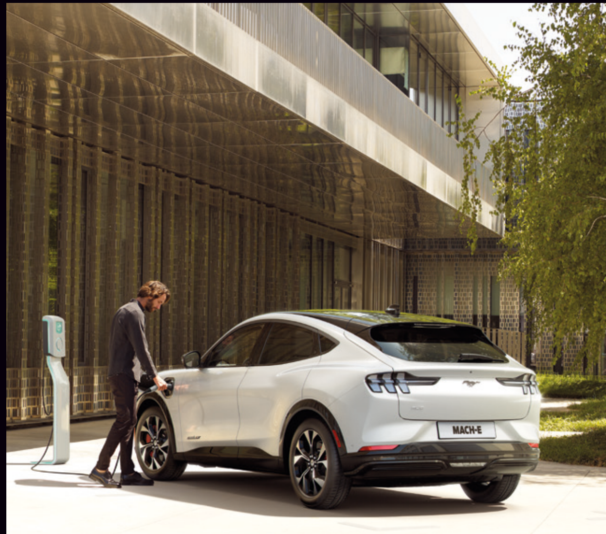
FORD MUSTANG MACH-E

Pamiętaj o tym, że obecnie w Polsce działa ok. 1500 ogólnodostępnych stacji ładowania - a ich liczba ciągle rośnie. Warto zapoznać się z aktualną bazą stacji przy planowaniu swojej podróży. System SYNC 4A w Mustangu Mach-E w prosty sposób pomoże Ci znaleźć pobliskie stacje ładowania i pokaże jak do nich dojechać.