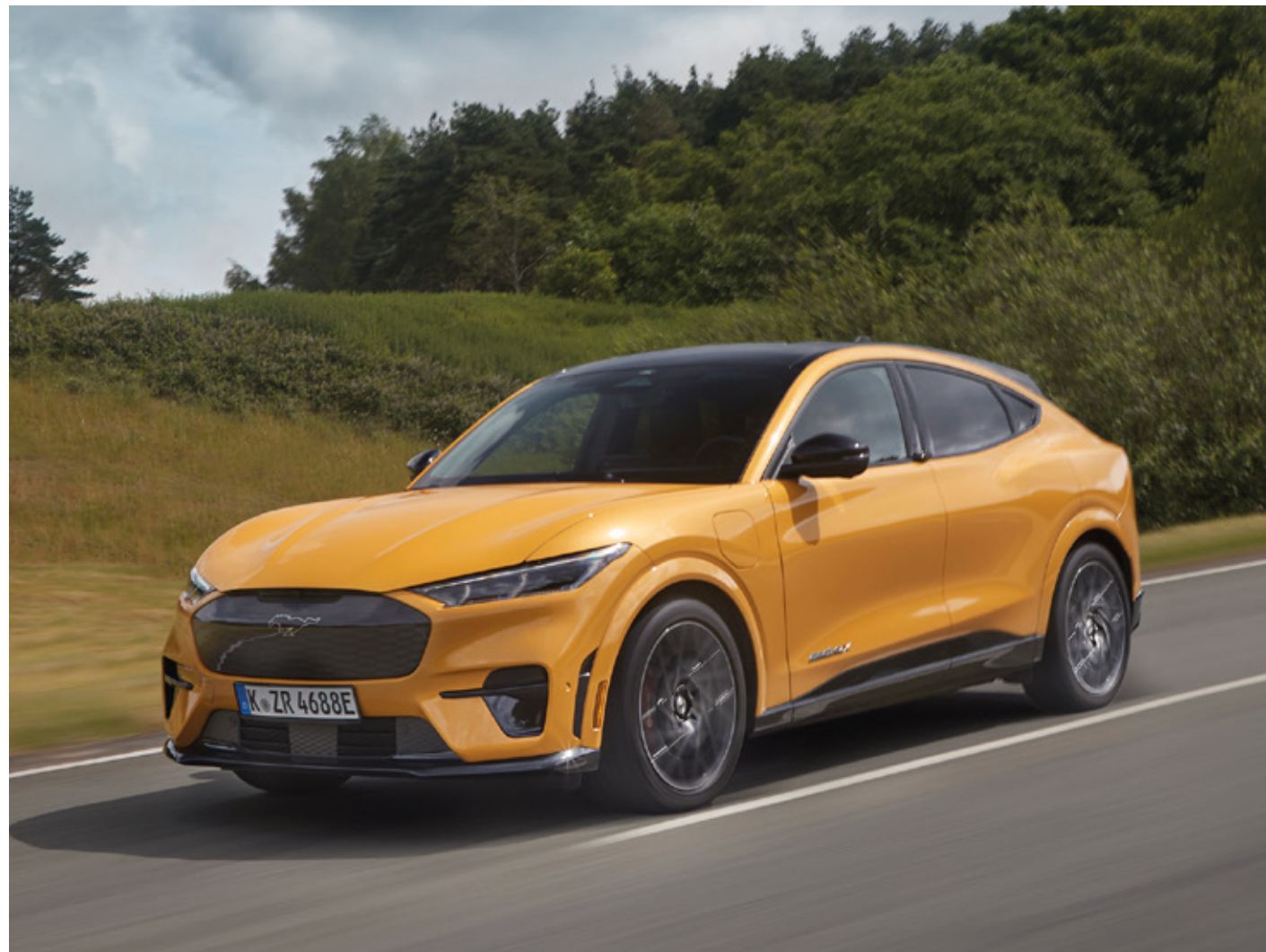
FORD MUSTANG MACH-E | GT | KOLOR NADWOZIA CYBER ORANGE (OPCJA) | SAMOCHÓD NA ZDJĘCIU WYPOSAŻONY W DACH PANORAMICZNY (OPCJA)