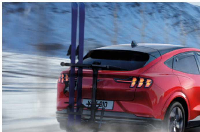
UCHWYT NA NARTY MONTOWANY DO HAKA HOLOWNICZEGO (2 483 279)