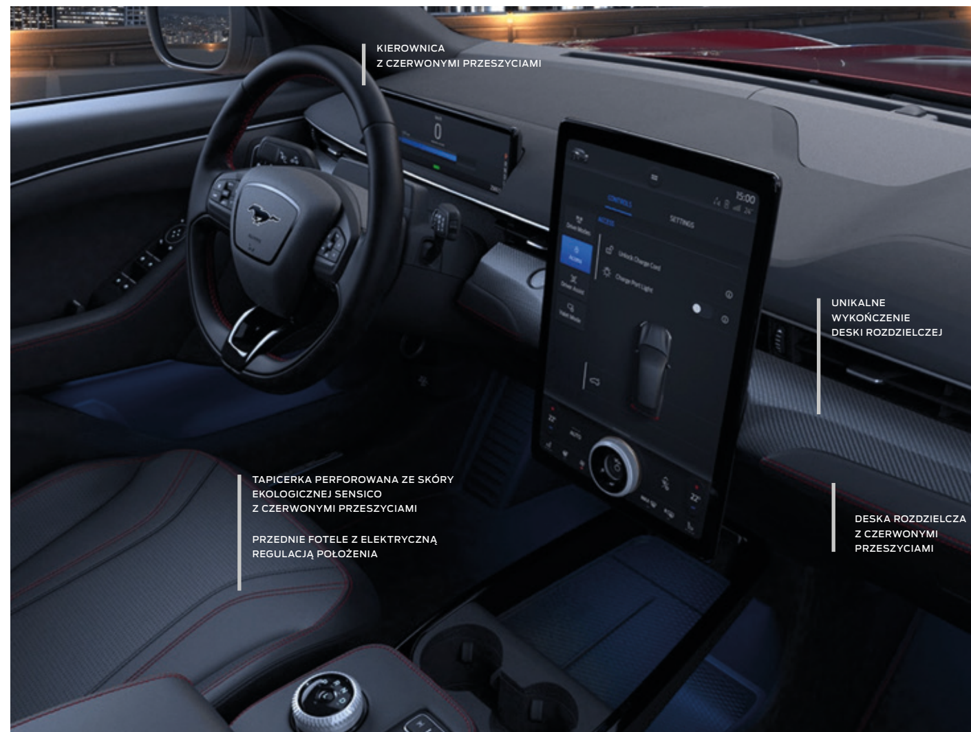
FORD MUSTANG MACH-E | AWD