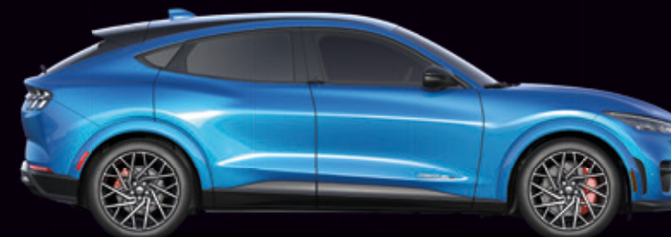
FORD MUSTANG MACH-E | GT | KOLOR NADWOZIA: GRABBER BLUE (OPCJA)

* czas ładowania szybką ładowarką DC (150 kW) 10-80%