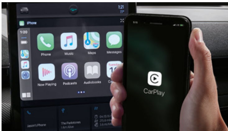
BEZPRZEWODOWA OBSŁUGA APPLE CARPLAY I ANDROID AUTO Standard dla wszystkich wersji. Wymaga kompatybilnego urządzenia.