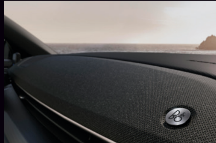
SYSTEM NAGŁOŚNIENIA B&O

Opcja dostępna w pakietach Technology oraz Technology Plus