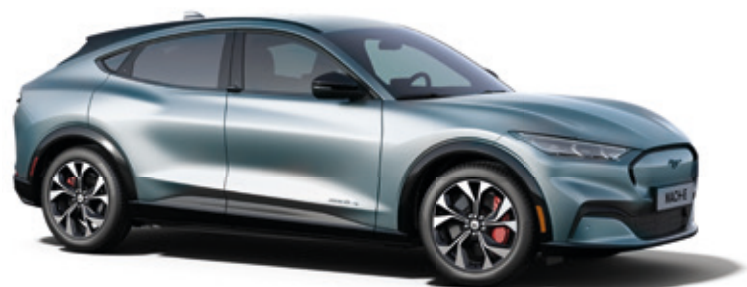
ICED BLUE SILVER - LAKIER METALIZOWANY 3 400,-