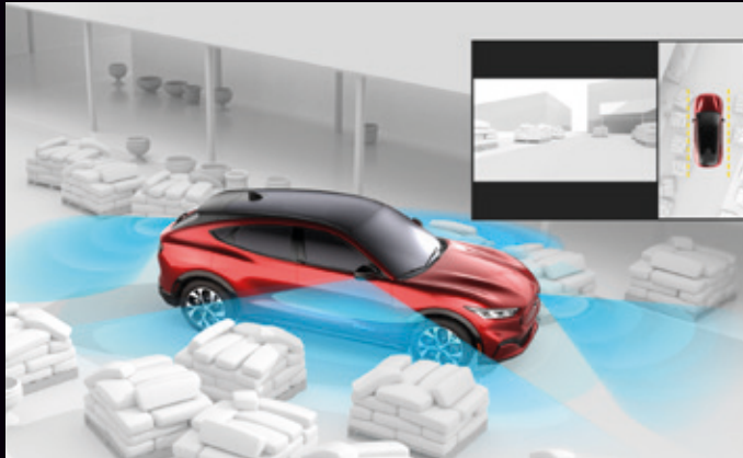
SYSTEM KAMER 360 STOPNI