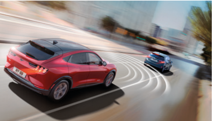
AKTYWNY TEMPOMAT Z FUNKCJĄ UTRZYMANIA POJAZDU NA ŚRODKU PASA RUCHU Standard dla wszystkich wersji