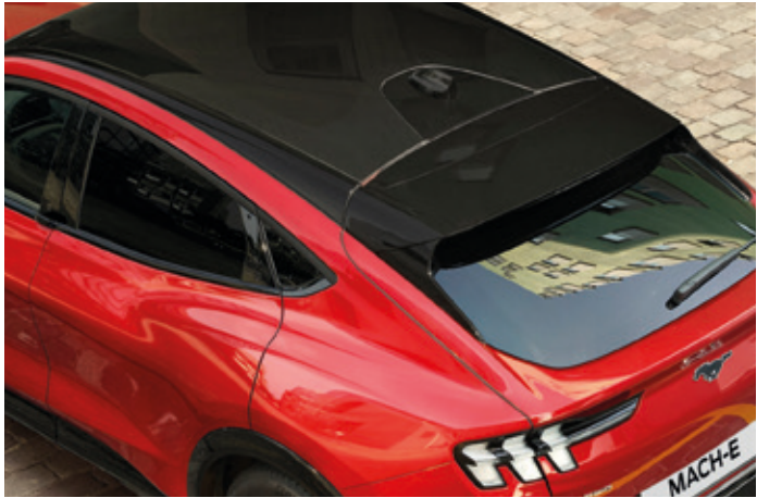
DACH PANORAMICZNY - NIEOTWIERANY Opcja dostępna w pakiecie Technology Plus