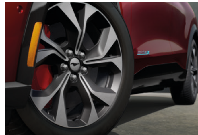
19" OBRĘCZE KÓŁ ZE STOPÓW LEKKICH Z ZACISKAMI HAMULCOWYMI W KOLORZE CZERWONYM Standard dla wersji AWD