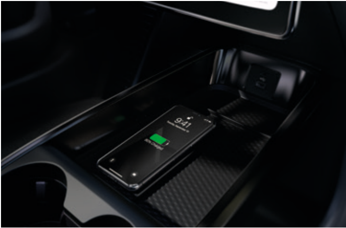
BEZPRZEWODOWA ŁADOWARKA Standard dla wszystkich wersji