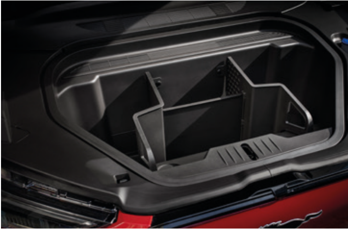
DODATKOWY BAGAŻNIK Z PRZODU POJAZDU O POJEMNOŚCI 81 LITRÓW Standard