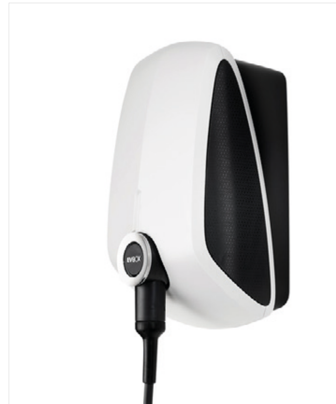
ELVI ŁADOWARKA ŚCIENNA WALLBOX Z ZAMONTOWANYM NA STAŁE KABLEM (2 443 729)

Inteligentne i wydajne rozwiązanie do ładowania w domu Twojego w pełni elektrycznego lub hybrydowego Forda. Bezpiecznie ładuje nawet do trzech razy szybciej niż w zwykłym gniazdku elektrycznym.