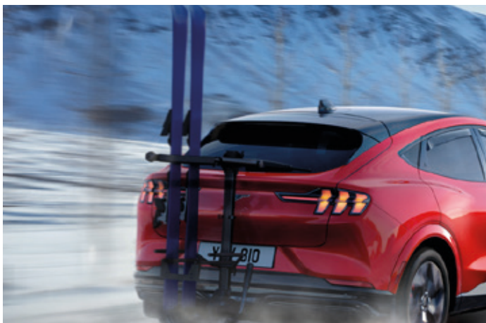
UCHWYT NA NARTY MONTOWANY DO HAKA HOŁOWNICZEGO (2 483 279)