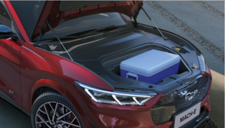
DODATKOWY BAGAŻNIK Z PRZODU POJAZDU O POJEMNOŚCI 81 LITRÓW Standard