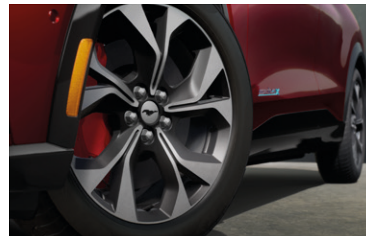
19" OBRĘCZE KÓŁ ZE STOPÓW LEKKICH Z ZACISKAMI HAMULCOWYMI W KOLORZE CZERWONYM Standard dla wersji AWD